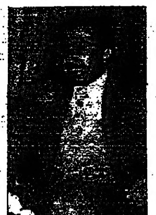
الوزير احمد اسكندر

اعل السيد احمد اسكندر وزير الاعلام السوري امس، ان القوات السورية تمتلك القدرة الكافية للتصدي والردع وتحقيق النصر في أية مواجهة كلفت دفاعاً من سوريا أو أية بقعة ارض عربية أخرى. وقال في لقاء صحفي بمشرف امس: لقد سبق ان هدت اسرائيل لتصل سد القنيطرة على نهر الفرات وحاولت